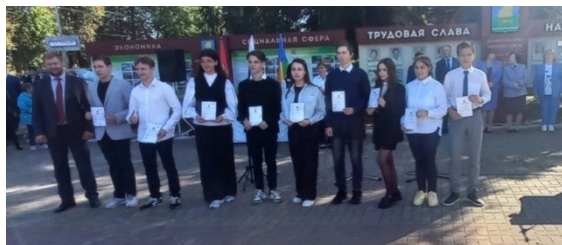
эстетическом районной дню Фетисова.