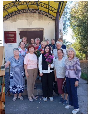
победителями многих творческих конкурсов.